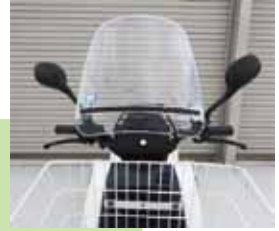
風防・マップランプ