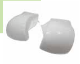
ハンドルプロテクタ