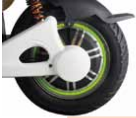
ハイパワーモーター