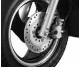
ディスクブレーキ