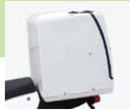
デリバリーボックス