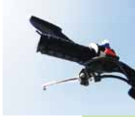
グリップヒーター

※写真は一例です。実際の商品とは異なる場合があります。 ※オプションパーツとその装着工賃は車両価格に含まれません。