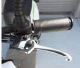
パーキングブレーキ